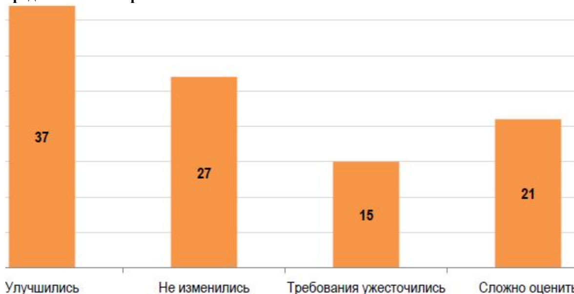
Рисунок 3. Распределение ответов по изменению условий получения кредитов в коммерческих банках.

Кроме того, по итогам опроса доля респондентов, оценивших уровень обеспеченности оборотными средствами как высокий составила 24%, а доля респондентов отметивших данный уровень как удовлетворительный – 68%.