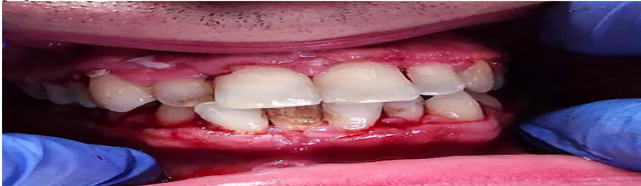
Rasm. 2. Arklar va simlarni olib tashlangandan keyingi bemorning periodontal holati.

- Jamiyatda periodontal davolanishga bo'lgan ehtiyoj indeksi (CPITN) [12].