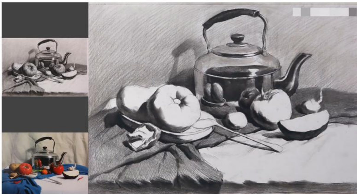
3-rasm. Natyurmort ishlashning 3-bosqichi.

3-bosqich. Yorug‘-soya munosabatlari yordamida jismlarning hajmini tasvirlash. Jismlarning perspektiv tasvirini ishlash davomida, ularning hajmi, joylashuvi va tushayotgan yorug‘lik darajasini ko‘rsata olish muhimdir. Bunga turli tus va qalam bosimidan foydalanish orqali erishiladi. Naturaning tus munosabati to‘q, o‘rta va yorqin tuslarning rasmdagi o‘zaro munosabatini, ularning tahlilini ko‘zda tutadi. Bir seansli o‘quv rasmlarda tus munosabatlari yoritilgan va soyadagi yuzalarni tasvirlash, hamda ushbu yuzalarning chegaralarini ko‘rsatish uchun qo‘llaniladi. Rasmda avvalo chegaralar, soya va yorug‘lik engil tuslarda belgilab olinadi. Jismning yoritilmagan yuzasi konturining atrofiga boshqa yuzalarning (devor, mato v.b) aksi tushadi va bu joyga jismning o‘z soyasiga nisbatan yorqinroq tus beriladi. Bunda jismlar nisbatlari rasm va naturani yorqin va to‘q tuslar munosabatini solishtirish orqali aniqlanadi. Yorug‘lik va soya yordamida tasvirga tabiiylik bahsh etish mumkin.