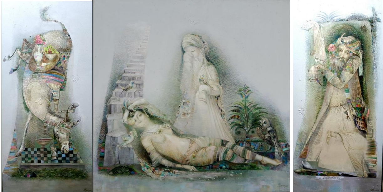
“Jannatda qish” Mato.m.b. (150x70sm), (150x150), (150x70sm) Triptix.

Qadim zamonlardan beri tasviriy san'at insoniyatning ma'naviy-madaniy tajribasini, avvalo estetikasini, diniy qarashlar, osha davrning siyosati ya'ni shu kabi muhim hodisalarni tarixga muhrlashning va insoniyatlarning qalbiga singdirishning eng samarali usuli bo'lib kelgan. Jamiyat o'zining estetik mohiyati bilan belgilanadigan san'atning kuchli samarali kuchidan turli xil ijtimoiy-utilitar maqsadlarda – diniy, siyosiy, terapevtik, epistemologik, axloqiy va boshqalarda foydalanishni o'rgangan. Nafaqat Osiyo balki Evropa hududlarida ham tasviriy san'at fan sifatida estetikaning muhim ob'ektlaridan biri bo'lib xizmat qilib kelgan. Tarixiy jihatdan o'rganadigan bo'lsak, tasviriy san'at asarlari madaniyatida estetika har doim san'atning mohiyatini tashkil etgan. Insoniyat sivilizatsiyasi tarixini kuzatib, estetik maqsadlar uchun yaratilgan turli xil asarlar namunalarini topish mumkin.