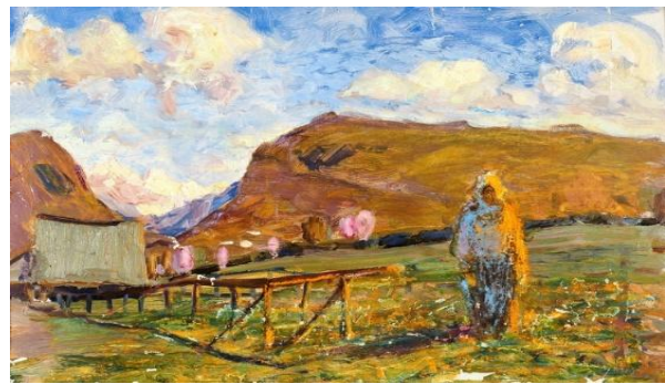
"Tog'da tong. Etüd". 1950-1960 yillar. Karton, moy bo'yoq.

Tarixiy, madaniy va ma'naviy-ahloqiy qadriyatlarning keng qatlamlarini qayta idrok etish g'oyalari, yangilanish tamoyillari me'morlik, tasviriy va amaliy san'at sohalarida yaqqol namoyon bo'lmoqda.