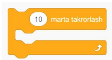
1 - Rasm. Buyruqni 10 marta bajaradi

Tsikl bu – bir xil turdagi harakatlarni ishga tushiruvchi tushuncha. Scratch muhitida tsikllar Boshqaruvchi blokida joylashgan bo'lib, ular har xil turlarga bo'linadi, masalan: 10 marta takrorlang, har doim takrorlang, ... qadar takrorlang .