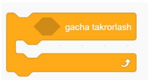
3-rasm Biror narsa sodir bo'lguncha (shart kiritiladi) buyruqni bajaradi

Scratch dasturlash muhitida "... marta takrorlash" buyrug'idan foydalaniladi. Uning uchun buyruqning bo'sh qismiga bajariladigan amallar ketma-ketligini kerakli bo'lgan algoritim asosida ko'rsatib chiqiladi, shundan so'ng dastur "... marta takrorlash" buyrug'idagi foydalanuvchi kiritadigan takrorlashlar soniga asosan amallar ketma-ketligini ko'rsatilgan algoritim bo'yicha takrorlab bajaradi