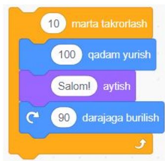
4-Rasm. Scratch dasturlash muhitida "... marta takrorlash" buyrug'iga misol

1-Misol. Scratch dasturlash muhitida Spraytni 100 qadam oldinga yurib "Salom!" so'zini aytib so'ngra 90 darajaga burilish harakatlar ketma-ketligi algoritmini 10 marta takrorlash uchun quyidagi buyruqlar ketma-ketligidan foydalanamiz (4-rasmga qarang).