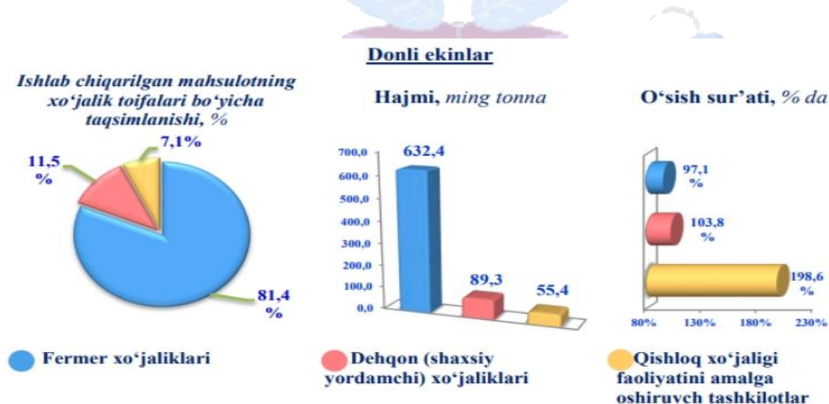
3-rasm. Qashqadaryo viloyati qishloq xo‘jaligida xo‘jalik toifalari bo‘yicha donli ekinlar yetishtirish ko‘rsatkichlari

Qishloq xo‘jaligida yetishtirilgan mahsulotlarning xo‘jalik toifalari bo‘yicha tahlil qilganimizda donli ekinlarning 81,4 %i, sabzavotning 73,7%i, poliz mahsulotlarining 49,1%i va meva va rezavorlarning 51,7%i fermer xo‘jaliklari hissasiga to‘g‘ri kelgan. Qolgan ulushlar esa dehqon xo‘jaliklari va qishloq xo‘jaligi faoliyatini amalga oshiruvchi tashkilotlari hissasini tashkil etadi. Misol uchun donli ekinlarni yetishtirishda xo‘jaliklar toifasi bo‘yicha tahlil qiladigan bo‘lsak, u quyidagi ko‘rinishga ega bo‘ldi (3-rasm).